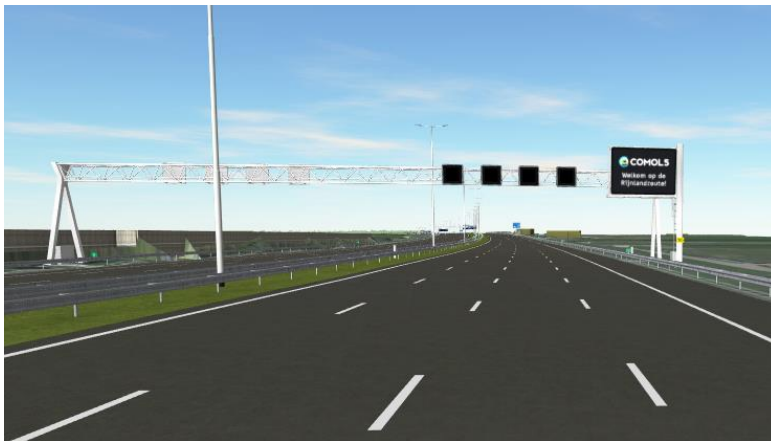
Voorbeeld van een DRIP

Comol5 is een internationale aannemerscombinatie van de TBI-ondernemingen Mobilis B.V. en Croonwolter&dros B.V., VINCI Construction Grand Projets S.A.S. en DEME Infra Marine Contractors B.V. De RijnlandRoute is een nieuwe wegverbinding van Katwijk, via de A44, naar de A4 bij Leiden. De weg lost huidige knelpunten op en garandeert de doorstroming in de regio Holland Rijnland, met name rondom Leiden en Katwijk. In opdracht van de Provincie Zuid-Holland is Comol5 verantwoordelijk voor de ombouw van knooppunt Leiden West, de bouw van de nieuwe N434 met geboorde tunnel en de aanpassingen aan de A4 en de A44. Comol5 wordt ook verantwoordelijk voor het 15-jarig onderhoud van de N434. Meer informatie over de RijnlandRoute algemeen is te vinden op de website van de provincie Zuid-Holland op www.rijnlandroute.nl . Via deze website kunt u zich ook aanmelden voor de digitale nieuwsbrief over de RijnlandRoute.